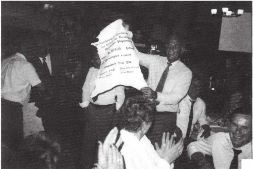
Papiermacher in froher Runde bei der Arbeitstagung 1982 in der Schweiz

Am 29. Mai eine Besichtigung der Pumpenbau- und Maschinenfabrik Emile Egger in Cressier/NE und am Nachmittag die Besichtigung der größten schweizerischen Zigarettenfabrik, die Vereinigten Tabakfabriken AG Neuchâtel, die als eine der modernsten Produktionszentren Europas und der Welt galt