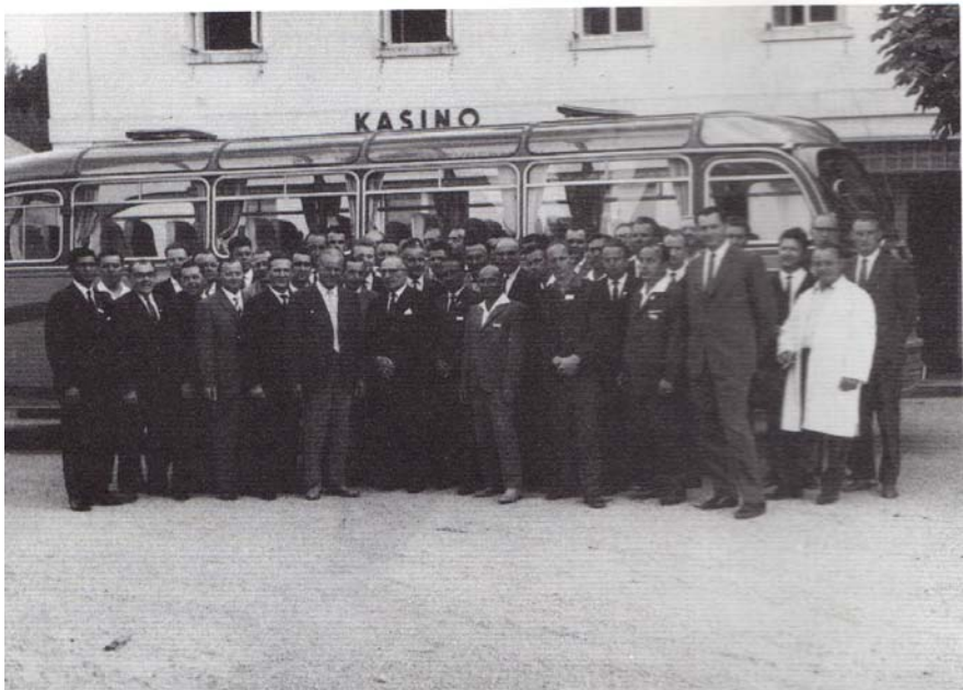
Papiermacher auf großer Fahrt

Letzteres hätte jedoch bedeutet, dass die Informations- und Studienfahrten der Gernsbacher Meister, nach bereits drei Reisen sang- und klanglos untergegangen wären!